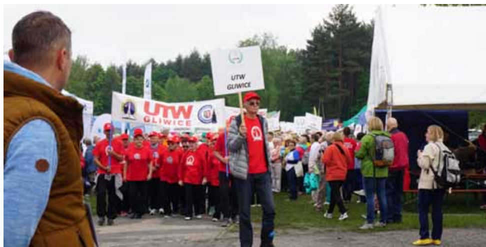
Defilada olimpijczyków z 71 UTW z Polski i zagranicy