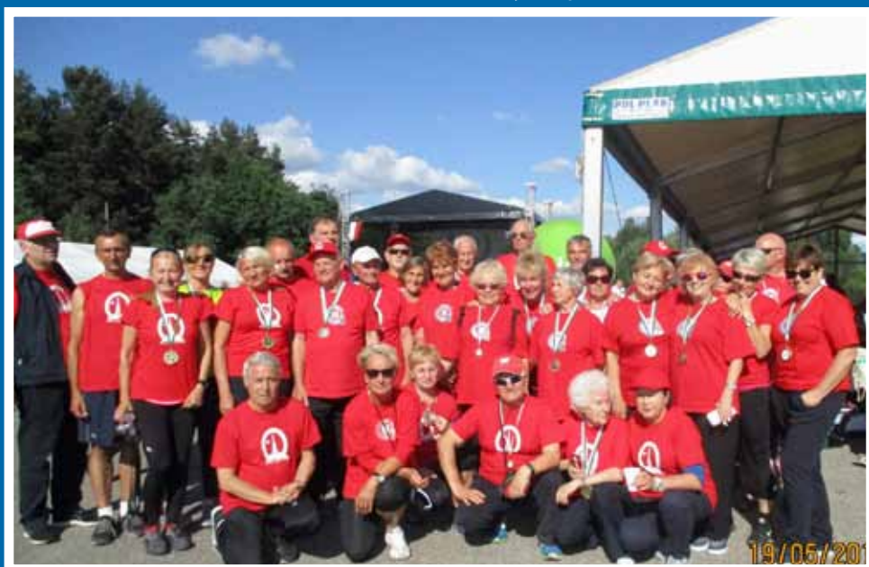
Nasza silna grupa olimpijska

www.utwgliwice.wordpress.com , e-mail: utw.gliwice@wp.pl