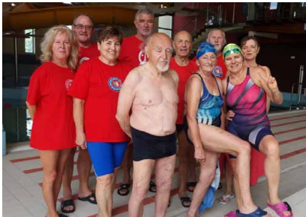
Pływacy z naszego UTW