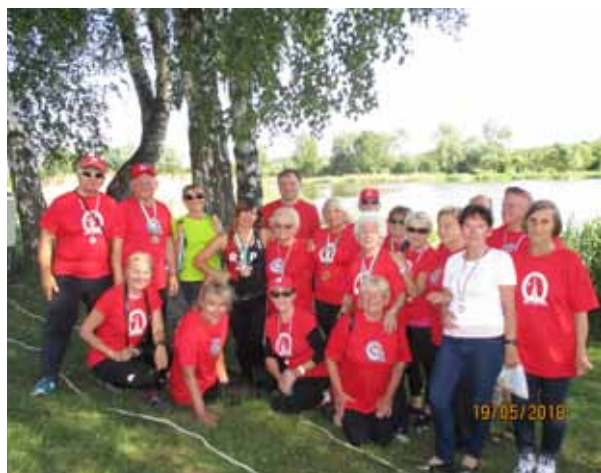
Nasi olimpijczycy nad Zalewem Mitręga