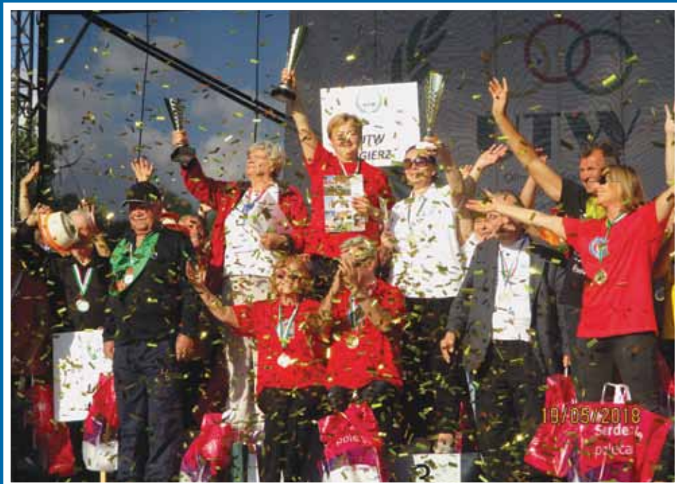
U honorowanie zwycięzców