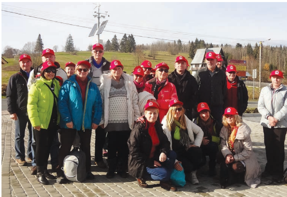
Zgrupowanie olimpijczyków w Zakopanem