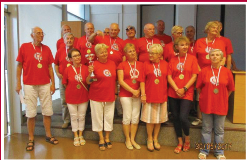
Szczęśliwi zwycięzcy dziękują prezydentowi Zygmuntowi Frankiewiczowi za patronat i partycypację w olimpiadach UTW.