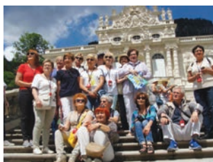
Pałac Ludwika II