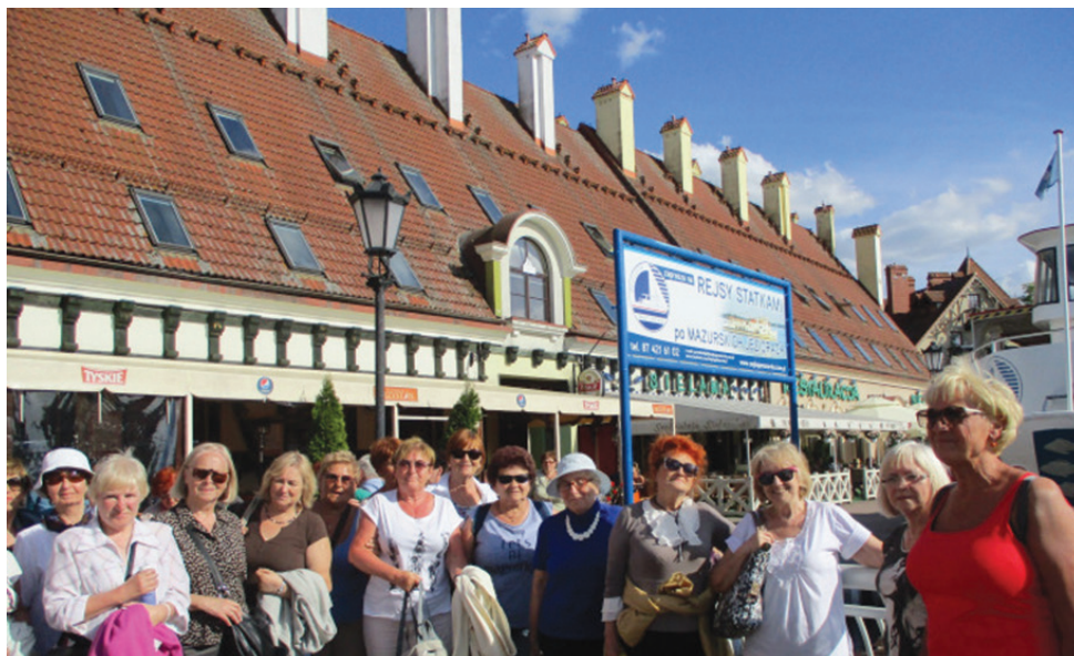
Mikołajki. Rejs statkiem.