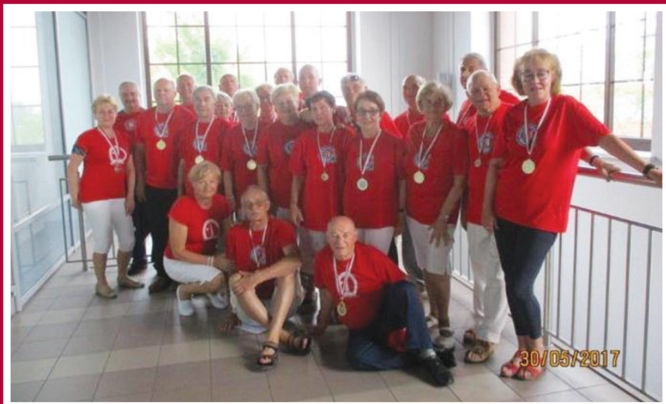
Zwycięska ekipa olimpijska UTW Gliwice