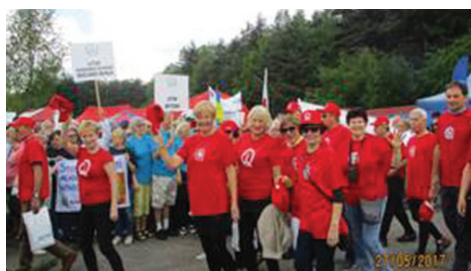
Defilada UTW w Łazach