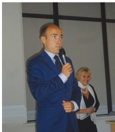
Wykład inauguracyjny dr Borysa Budki

Oprawę artystyczną inauguracji roku akademickiego 2016/2017 zapewnili członkowie zespołu muzycznego „Baltic” będący uczniami Szkoły Muzycznej II stopnia w Gliwicach.