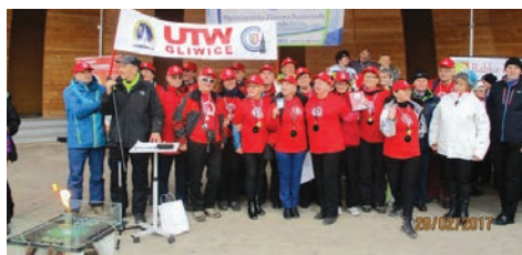
Zwycięska ekipa z medalami.