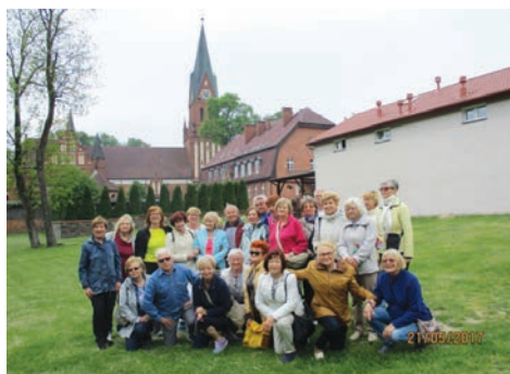
Malbork. Zamek krzyżacki.