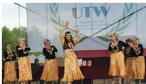
Zespół UTW „Szalone Kryški” w tańcu hawajskim