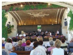
Koncert w parku Garmisch Partenkirchen