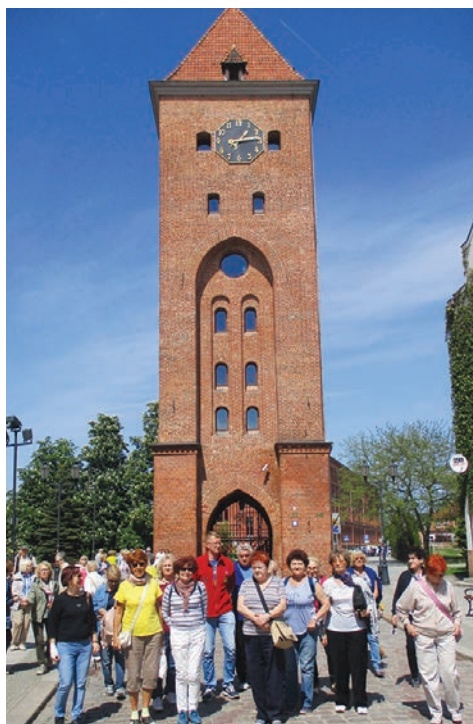
Elbląg. Brama Targowa.