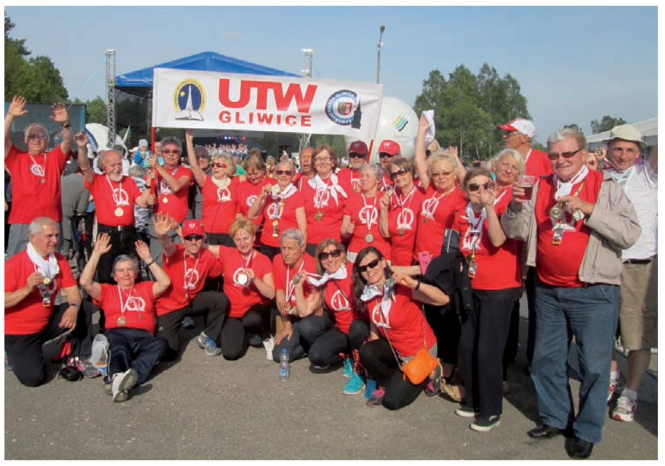
Zwycięska ekipa olimpijska UTW Gliwice