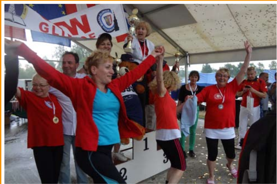
Złoty puchar olimpijski.

www.utwgliwice.wordpress.com , e-mail: utw.gliwice@wp.pl