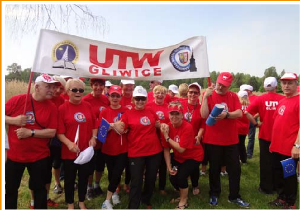
Zwycieska ekipa olimpijska UTW Gliwice