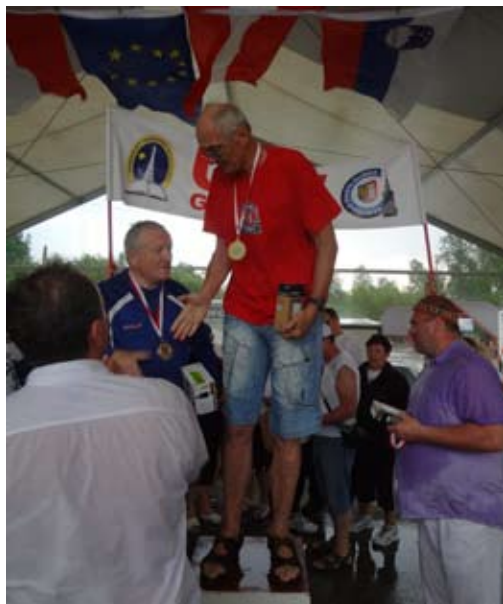
Czesław Okoński - złoto w biegach. Trener kadry olimpijskiej.

Projekt olimpijski pt. Akademia zdrowego seniora dzięki któremu możliwy był nasz sukces był współfinansowany ze środków miasta Gliwice na wsparcie realizacji zadania publicznego w dziedzinie „Wspierania i upowszechniania kultury fizycznej.