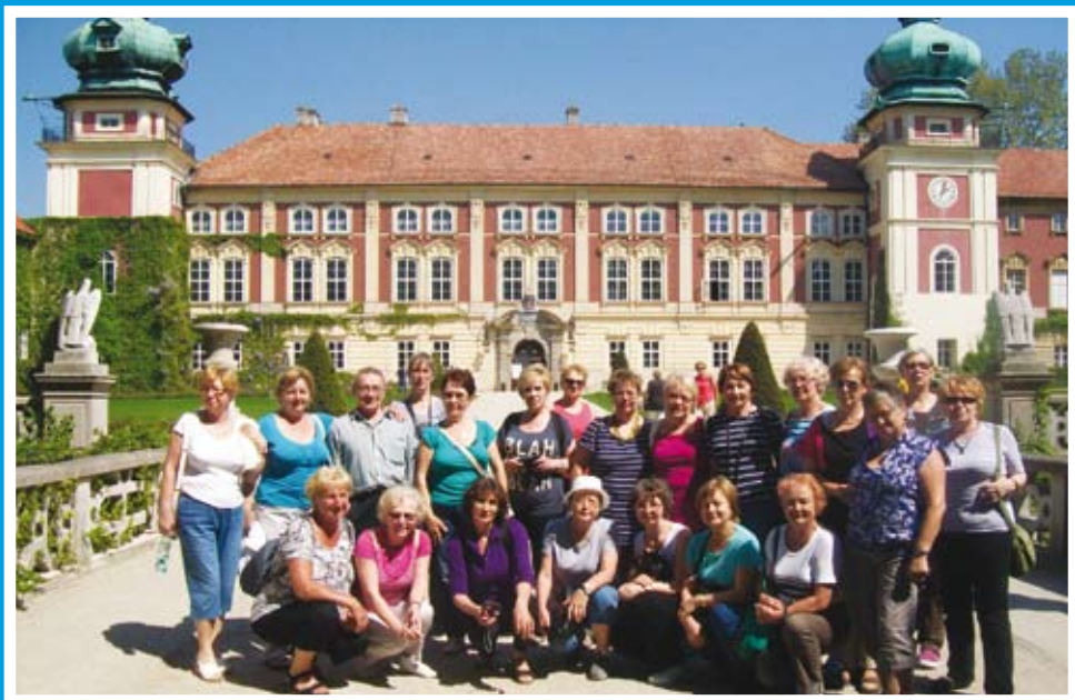
Studenci UTW w Łańcie.

www.utwgliwice.wordpress.com , e-mail: utw.gliwice@wp.pl