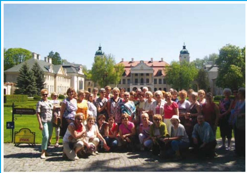
Studenci UTW w Kozłowie.