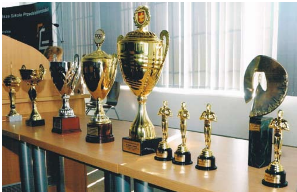
Oskary wręczone najbardziej zasłużonym studentkom UTW. Puchary zdobyte na olimpiadach UTW i Gliwiczusz Prezesa.