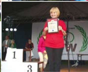
Studenci UTW promują Gliwice