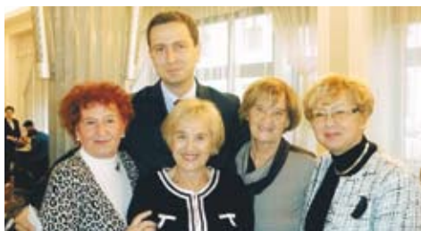
Zarząd UTW w Parlamencie z ministrem pracy Władysławem Kosiniakiem-Kamyszem