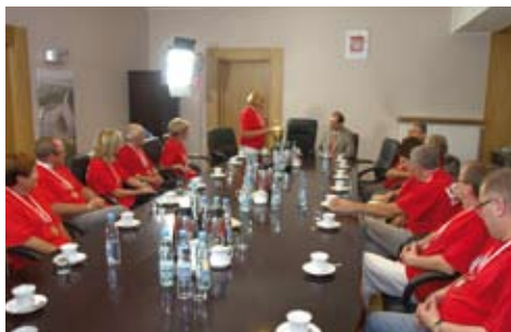
Wizyta olimpijczyków u Prezesa Głiwic