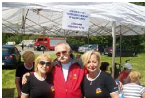
Studenci UTW promują swoje miasto