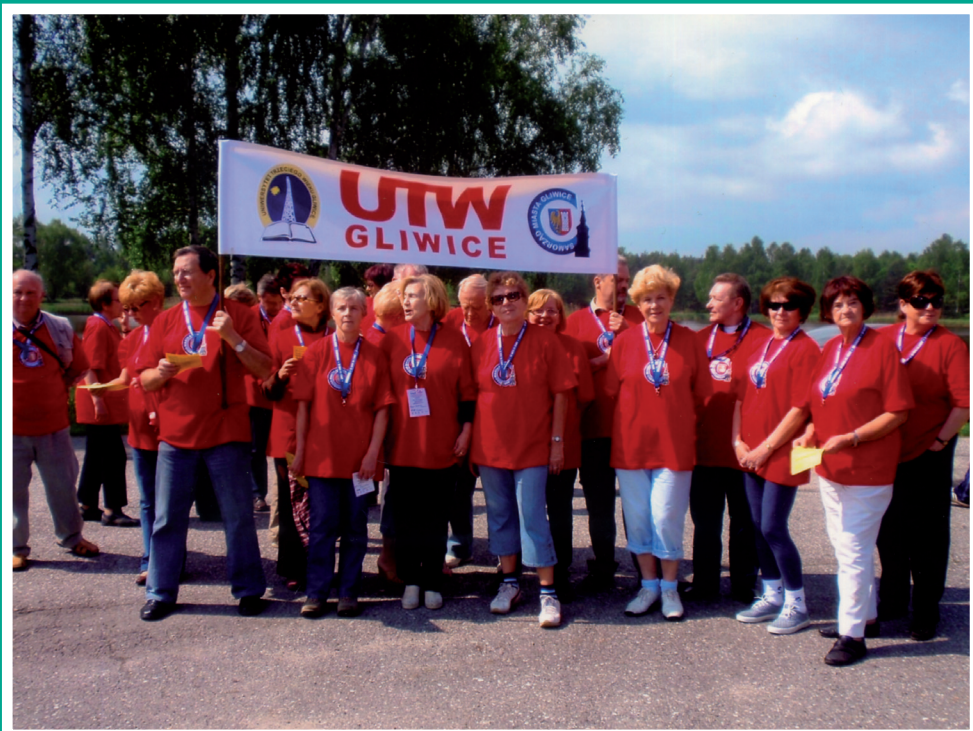
Ekipa olimpijska UTW Gliwice.