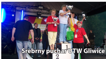
Srebrny puchar UTW Gliwice