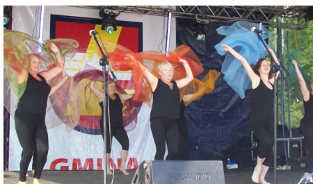
Grupa baletowa UTW Gliwice